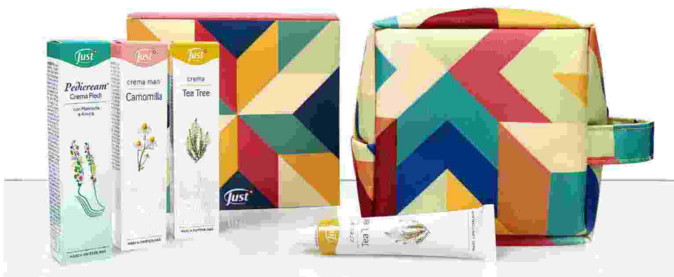
Il set benefico di Just. Sotto la sede dell'azienda

Sono appena nati, e sono affetti da una malattia genetica rara. Ma una diagnosi adeguata e una terapia su misura possono aiutarli ad affrontare la vita. Eppure, per quanto sembri incredibile, è proprio questo il primo problema e tanti bambini sono colpiti da una doppia difficoltà, quella della malattia e quella della sua "rarità" che rende complicata, a volte impossibile, una diagnosi corretta. Secondo i dati più recenti, 5 persone su 10.000 soffrono di patologie rare e ben il 25% dei malati attende una diagnosi adeguata per lungo tempo, a volte addirittura per anni. All'elaborazione di una diagnosi specifica (il vero punto di svolta) e alla presa in carico di bambini affetti da malattie rare è dedicato il Progetto di assistenza sociosanitaria "Il domani nei miei sogni", messo a punto da Fondazione Just Italia nel quadro delle proprie iniziative di Responsabilità Sociale. Partendo da una donazione con un importo minimo garantito di € 200.000 alla FMRI - Federazione Malattie Rare infantili che coordina le Associazioni sul territorio dalla sede centrale presso l'Ospedale Infantile Regina Margherita di Torino. Fondazione Just Italia, creata dall'omonima